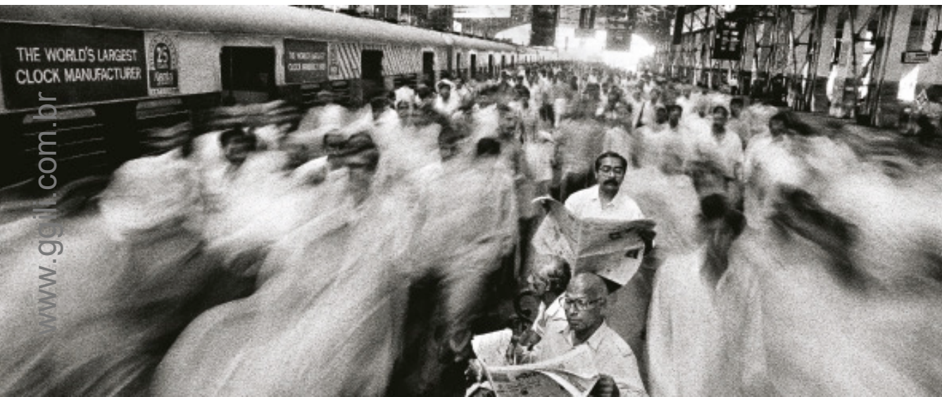
Raghu Rai, Mumbai, 1995

Em 2012, a IPA produziu uma lista fascinante dos vinte fotógrafos mais influentes na Ásia, que colocou Daido Moriyama, Nobuyoshi Araki e Raghu Rai respectivamente como números 1, 2 e 3. Também na lista estava Fan Ho, fotógrafo, ator e cineasta de Hong Kong. Para mim, e muitos outros, as primorosas fotos P&B de Hong Kong na década de 1950 feitas por Fan Ho são uma revelação. Descobrir um fotógrafo relativamente obscuro com esse tipo de trabalho tão lindo reforça nossa convicção de que sempre há mais a descobrir.