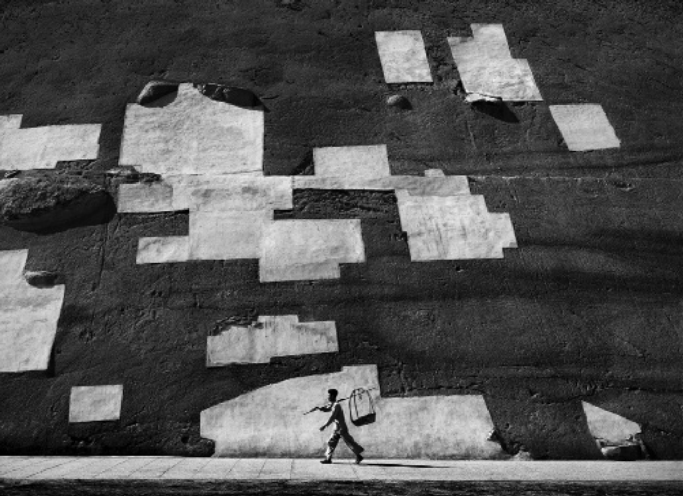
Fan Ho, Hong Kong, 1956

Uma questão distinta, mas relacionada, é a perspectiva da fotografia de rua encontrada em galerias comerciais. Essa é uma questão complexa sobre valores percebidos, interesse público e apresentação – ou talvez simplesmente sorte ou ambição. O mercado fotográfico é um tema importante; ousar dizer que a fotografia de rua acaba em galerias sofisticadas mais por sorte do que por valor artístico.