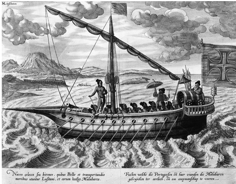
FIG. 1: Barco ( fusta ) de portugueses com os característicos chapéus e tripulação malabar (Jan Huygen van Linschoten, Itinerario: Voyage ofte schipvaert van Jan Huyghen van Linschoten naer Oost ofte Portugaels Indien, 1579-1592 ; ed. port. Itinerário [...] )

No conjunto, elas podem ser consideradas como uma outra face do «império», cuja história, discreta, ambígua, e frequentemente menos cómoda, tem sido pouco cultivada na historiografia portuguesa.