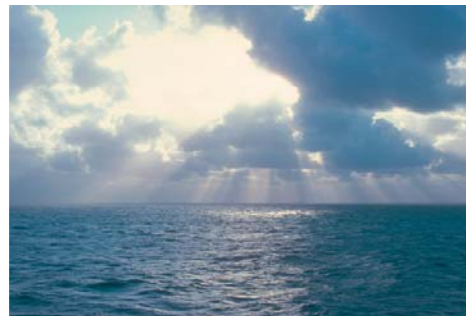
Exemplos de paisagens naturais