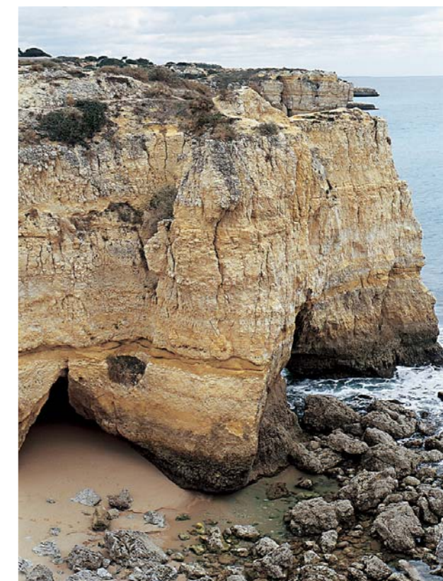
Costa de arriba

Os rios são um elemento presente em muitas paisagens. Correm pela superfície da Terra, seguindo diferentes direcções e modelando o relevo em seu redor.