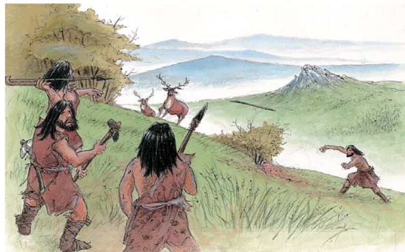
Fig. 1 – Caçadores do Paleolítico

A sobrevivência do Homem do Paleolítico dependia dos recursos que encontrava na Natureza: frutos e vegetais, caça e pesca. Praticando uma economia recolectora , o aperfeiçoamento das técnicas tornou-se uma exigência. Este tipo de economia implicava o nomadismo . Surgem então as sociedades dos grandes caçadores e a economia de caça. O desenvolvimento técnico e a caça em grupo possibilitaram uma maior eficácia da actividade recolectora, permitindo-lhe vencer dois importantes inimigos: a fome e o frio.